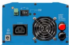
Phoenix Inverter 12/800 with IEC-320 socket