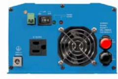
Phoenix Inverter 12/800 with Nema 5-15R socket