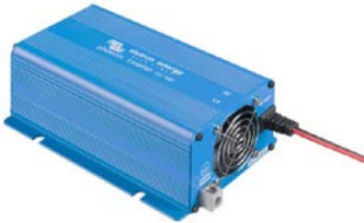
Phoenix Inverter 12/180