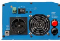
Phoenix Inverter 12/800 with Schuko socket