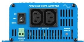
Phoenix Inverter 12/350 with IEC-320 sockets