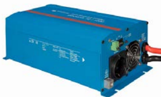
Phoenix Inverter 12/800 with Schuko socket