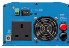
Phoenix Inverter 12/800 with BS 1363 socket