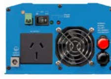
Phoenix Inverter 12/800 with AN/NZS 3112 socket