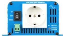
Phoenix Inverter 12/180 with Schuko socket