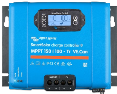
Controlador de carga SmartSolar MPPT 150/100-Tr-VE.Can con pantalla conectable opcional