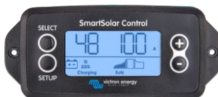
Pantalla conectable SmartSolar

Simplemente retire el protector de goma del enchufe de la parte frontal del controlador y conecte la pantalla.