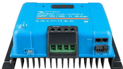
Controlador de carga SmartSolar MPPT 150/100-Tr-VE.Can sin pantalla