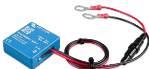
Sensor Bluetooth: Smart Battery Sense