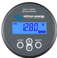
Sensor Bluetooth: Monitor de baterías BMV-712 Smart